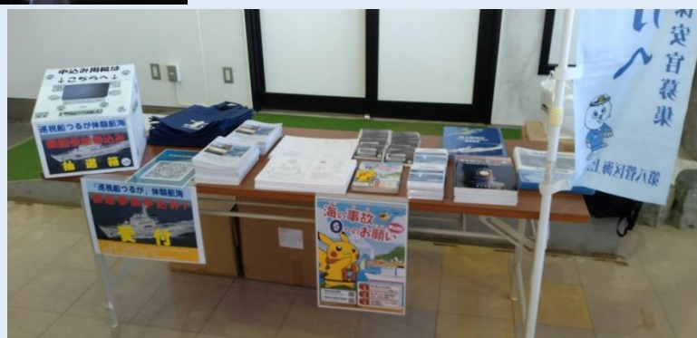
水仙ランドの保安部ブース

敦賀海上保安部では、『11月1日の「灯台記念日」』を前に、10月19日に越前岬灯台の一般公開を行いました。